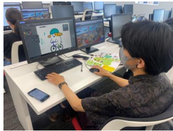
「みちまるくん」のサイクリングバージョンの制作風景