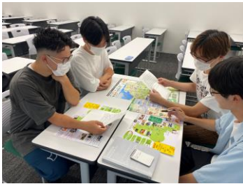
静岡SAを拠点としたオクシズサイクリングマップの制作風景