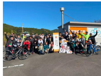
オクシズ サイクリングイベントの実施 (新東名 静岡SAの自転車の駅)