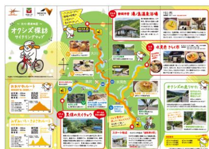
NEXCO中日本オリジナルキャラクター みちまるくんサイクリングバージョン