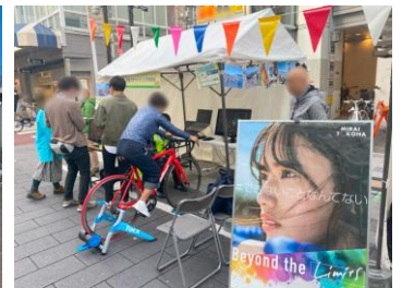
しずおかサイクルフェスに出店 (静岡市交通政策課 主催)